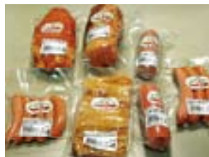
手作りハム・ソーセージ

近年、中央市の農業では、稲作から野菜を中心とする近郊農業への移行が進んでいます。田富・玉穂地区の米やトマト、ナス、キュウリ、豊富地区のスイートコーンが有名です。また、これらの農産物や畜産物を利用した加工品の生産も進められています。豊富地区で飼育されたこだわりの豚肉を使った手作りハム、ソーセージをはじめ、コーン100%焼酎「恵」、ブドウとコーンを使ったワイン「夢」など新製品も次々と開発されています。