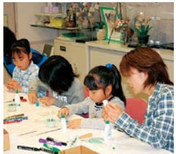
シルクフラワーの制作