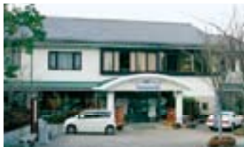
シルクふれんどりい

豊富地区の「シルクふれんどりい」はシルク工芸館とふれあい館を併設した宿泊施設で、日本有数の高アルカリ性硫酸温泉が利用できます。工芸館ではつむぎ織り、陶芸のほか繭玉を使ったシルクフラワー制作などの工芸体験ができます。レストランシルクも人気です。