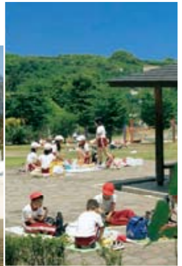
巨大遊具が人気のシルクの里公園