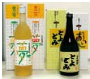
ワイン「夢」と焼酎「恵」

近年、中央市の農業では、稲作から野菜を中心とする近郊農業への移行が進んでいます。田富・玉穂地区の米やトマト、ナス、キュウリ、豊富地区のスイートコーンが有名です。また、これらの農産物や畜産物を利用した加工品の生産も進められています。豊富地区で飼育されたこだわりの豚肉を使った手作りハム、ソーセージをはじめ、コーン100%焼酎「恵」、ブドウとコーンを使ったワイン「夢」など新製品も次々と開発されています。