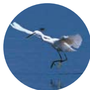
市の鳥・しらさぎ