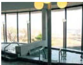
身も心も癒される温泉