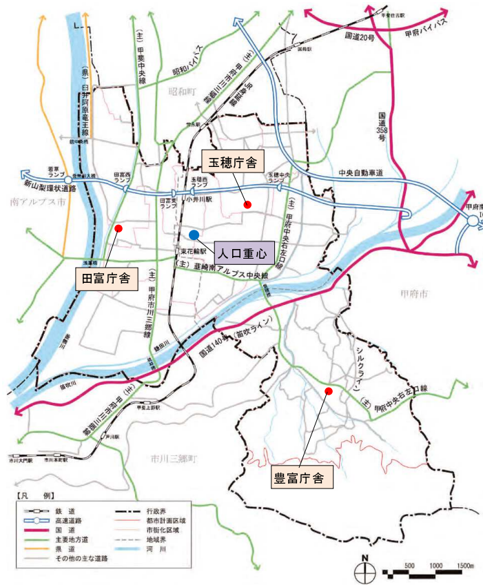
図 2.1-1 3庁舎と人口重心

3庁舎（田富・玉穂・豊富庁舎）の位置図及び中央市の人口重心（中央市住民の居住地点からなる図形の重心）を以下に示す。