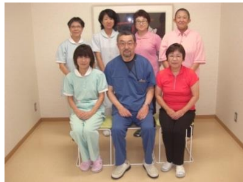
中央市認知症初期集中支援チーム

中央市では「玉穂ふれあい診療所」に委託し、今年の5月から 認知症初期集中支援チームが始動しました！