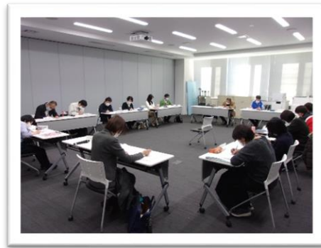
令和3年度 第3回包括ケア部会