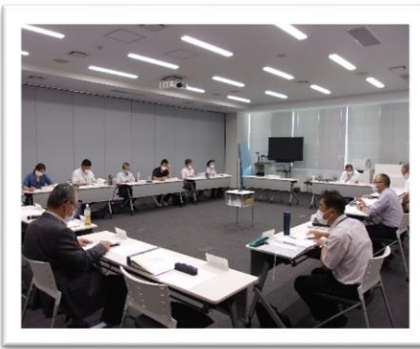
令和3年度 第2回自立支援協議会

自立支援協議会は感染防止対策でZOOMの会議を取り入れながら本会は予定通りの3回、他の部会もほぼ予定通りの開催をしてきました。令和3年度は、包括的な相談支援体制について協議しました。包括的な相談支援とは「断らない、社会とのつながりや参加を支援する、地域などで支えあう関係性を育成する(厚生労働省の検討会より抜粋)」をさします。今後も障がい福祉だけでなく子育て支援、高齢者支援などと連携していこうということを確認しました。また計画相談員への後方支援としてできることを協議して、必要なことは何かのアンケート調査を実施しました。