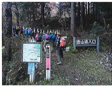
トレッキング事業 12/10(水) たいら山