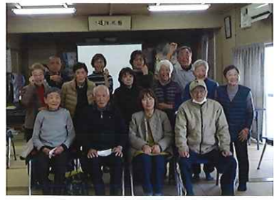
認知症サポーター養成講座 12/10(水) 井之口自治会