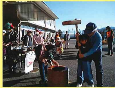
多世代交流会(もちつき) 1/6(火) ことぶきマスター連絡協議会