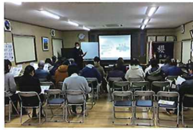
認知症サポーター養成講座 1/31(土) 桜自治会