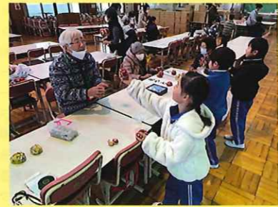
昔の遊び教室 豊富小学校 1/13(火) ことぶきマスター連絡協議会