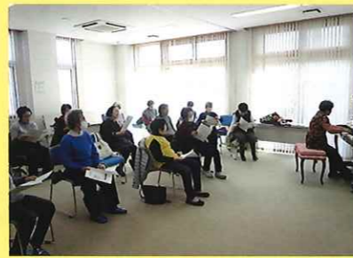
歌声教室 1/28(水) ことぶきクラブ玉穂支会女性部