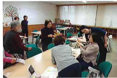
健康まなびや 『メイクアップ教室』 3/25 (水) 玉穂総合会館