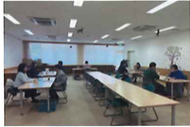
婚活パーティー 2/21 (土) 玉穂総合会館