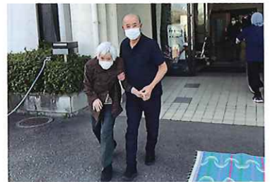
避難訓練 3/24 (火) シルクの里デイサービスセンター