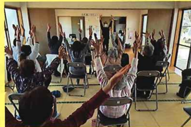
やってみるじゃん教室 高部 3/19 (木) ことぶきクラブ 豊富支会