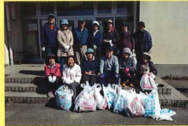
環境整備 3/9 (月) ことぶきマスター連絡協議会