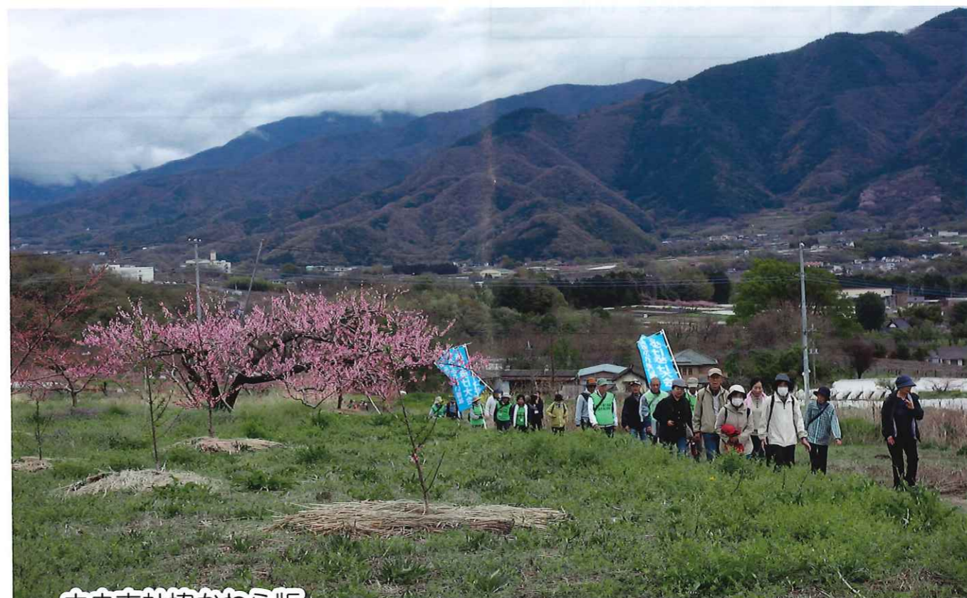
中央市社協かわら版

■相談日 5月9日(土) 午前10時~午後3時 5月20日(水) 午後6時~8時 ■会場 玉穂総合会館 ※要予約 (055-274-0294)、相談無料