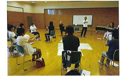
地域でできる レクリエーション講座

様々な事業の一部紹介です！今年度も様々な事業を企画していきますので是非ご協力をお願いします！また、地域での困りごとなど何かありましたらご相談ください。