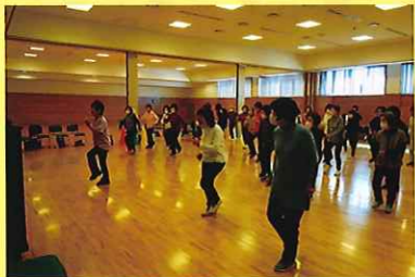
リズム体操教室 2/15 (日) ことぶきクラブ連合会