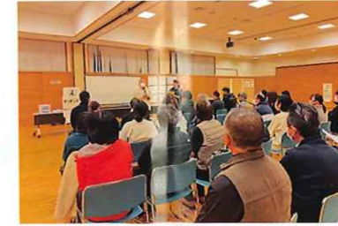
災害ボランティアセンター 運営協力員養成講座