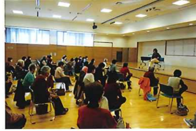
健康まなびや 『椅子ヨガ教室』 3/4 (水) 玉穂総合会館