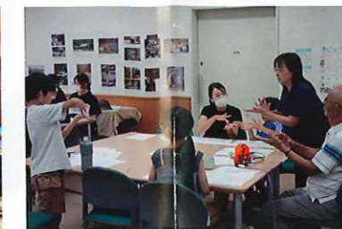
夏休みボランティア体験講座