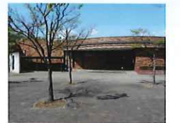
田富コミュニティセンター

田富コミュニティセンターでは、福祉公園とコミュニティセンターの管理事務を行っています。