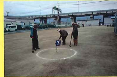
グラウンドゴルフ普及研修会 3/23 (月) ことぶきマスター連絡協議会