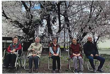
お花見 角川公民館 3/25 (水) ~ 27 (金) シルクの里デイサービスセンター