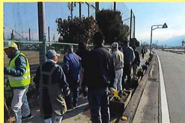
春の花植え 3/12 (木) ことぶきクラブ 玉穂支会