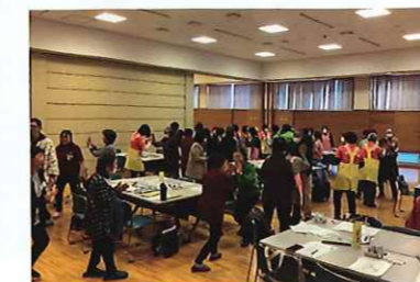
ボランティア活動推進