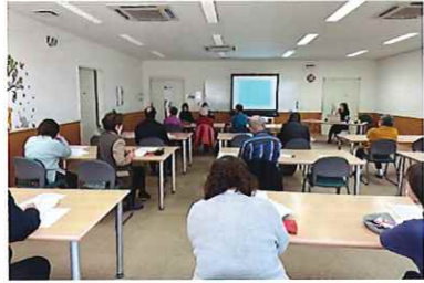
成年後見制度市民講座 2/24 (火) 玉穂総合会館