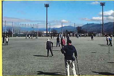
グラウンドゴルフ大会 2/25 (水) ことぶきクラブ 田富支会