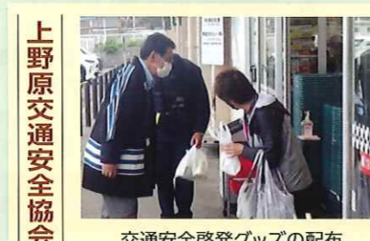
上野原交通安全協会 交通安全啓発グッズの配布