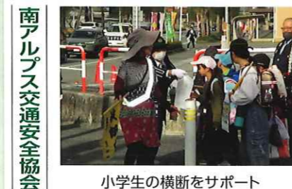
南アルプス交通安全協会 小学生の横断をサポート