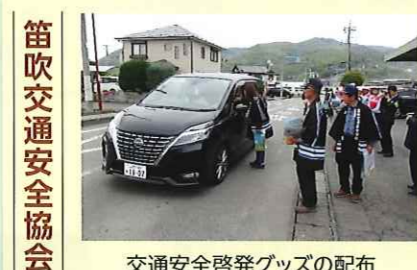
笛吹交通安全協会 交通安全啓発グッズの配布