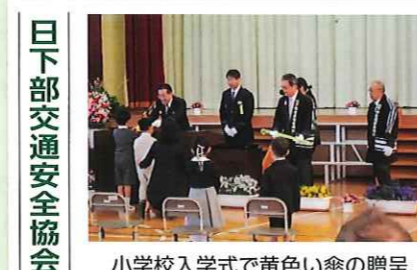
日下部交通安全協会 小学校入学式で黄色い傘の贈呈