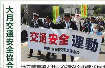
大月交通安全協会 地元警察署と共に交通安全の呼びかけ