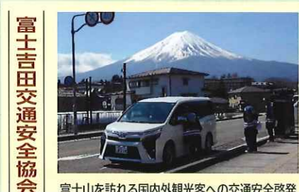
富士吉田交通安全協会 富士山を訪れる国内外観光客への交通安全啓発