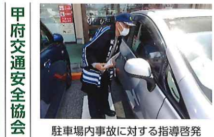
甲府交通安全協会 駐車場で車検指導