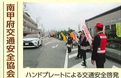
南甲府交通安全協会 ハンドプレートによる交通安全啓発