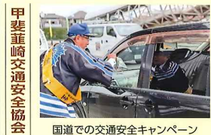
甲斐韮崎交通安全協会 国道での交通安全キャンペーン