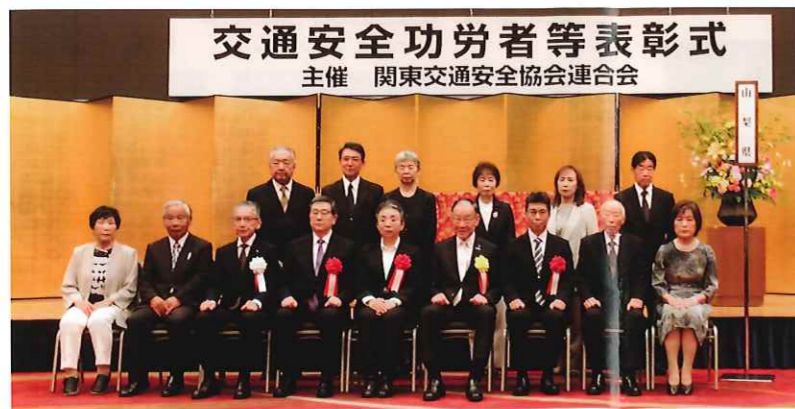
関東交通安全協会連合会交通安全功労者