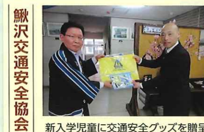
鵜沢交通安全協会 新入学児童に交通安全グッズを贈呈