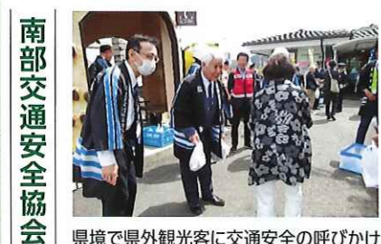
南部交通安全協会 県境で県外観光客に交通安全の呼びかけ