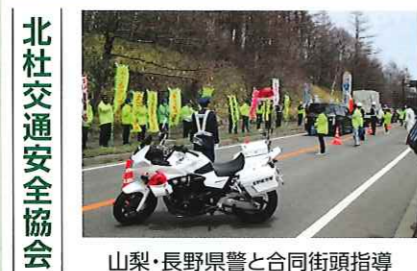
北社交通安全協会 山梨・長野県警と合同街頭指導