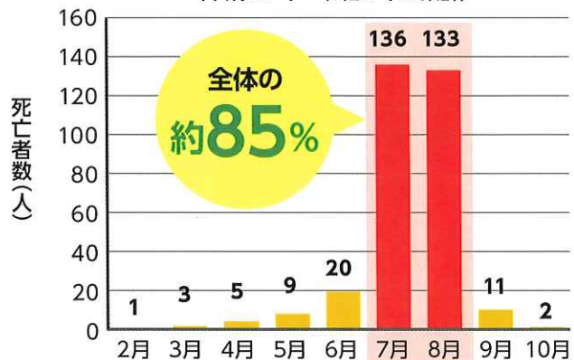
農作業中の熱中症による月別の死亡事故件数 (平成27年~令和6年の累計)

熱中症事故は、周りの人がお互いに気を配り、声をかけ合うことで、防げる可能性があります!