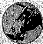
航空自衛隊の戦闘機

自衛隊山梨地方協力本部巨摩募集案内所では自衛隊を知っていただくための各種イベント（車両、艦艇、航空機体験搭乗や基地見学）を用意しています。お気軽にお問い合わせください。※イベントにより年齢制限があります。