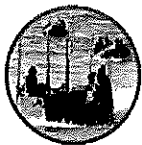
陸上自衛隊の兵隊

確かに陸上自衛隊はほく前進も行きます。ですが、それは多種多様な訓練・業務等の中の一つの要素でしかありません。自衛隊は自己完結型の組織であり、陸上自衛隊の中でも幅広い種類の仕事があります。全ての部隊、隊員が直接的に戦線に従事することを期待されている訳ではなく、部隊の活動を支援するための部隊や業務も多くあり、デスクワークを主体とする勤務も多くあります。海上自衛隊も海で活躍する部隊は実は全体の1/3。残りの2/3は海上自衛隊の航空部隊での空の仕事が1/3。デスクワークなどを含めた陸の仕事が1/3。航空自衛隊もおよそ30ある職種・職域の中で、直接的に航空機に携わっている職種は2割もありません。弾道ミサイルなどに地上から対応する部隊も航空自衛隊。救難業務だって航空自衛隊。その他は陸上自衛隊や海上自衛隊と同じくデスクワークを含めた後方支援部隊が多数を占めます。