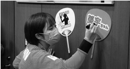
応援グッズにサインをいただきました