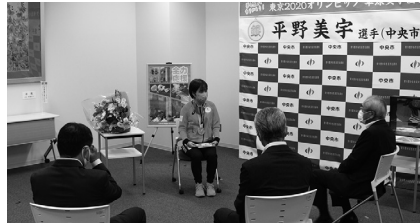
試合のときの心境などを話してくれました