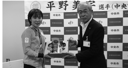
中央市産の野菜や果物を贈りました