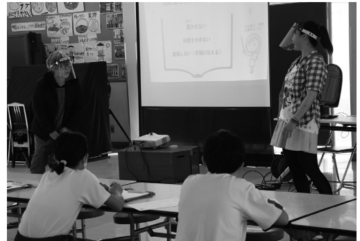
劇などを通して、認知症について正しい知識を学びました

認知症に関する理解を深め、認知症の人たちの応援者になってもらうことを目的に「認知症キッズサポーター養成講座」が開催されました。劇やクイズなどで理解を深めた児童からは「近所に認知症の人がいたら、教わったことを思い出して助けてあげたい」などの感想を聞くことができました。