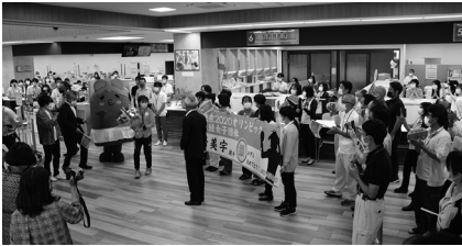
世界で活躍する平野選手をみんなでお出迎え！