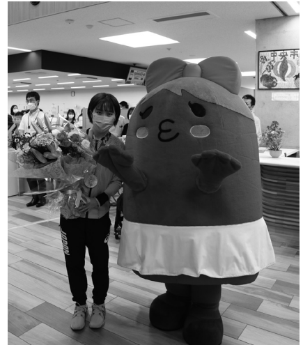
とまチュウも駆けつけました♪