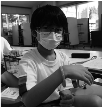
講座修了の証のオレンジリング

認知症に関する理解を深め、認知症の人たちの応援者になってもらうことを目的に「認知症キッズサポーター養成講座」が開催されました。劇やクイズなどで理解を深めた児童からは「近所に認知症の人がいたら、教わったことを思い出して助けてあげたい」などの感想を聞くことができました。