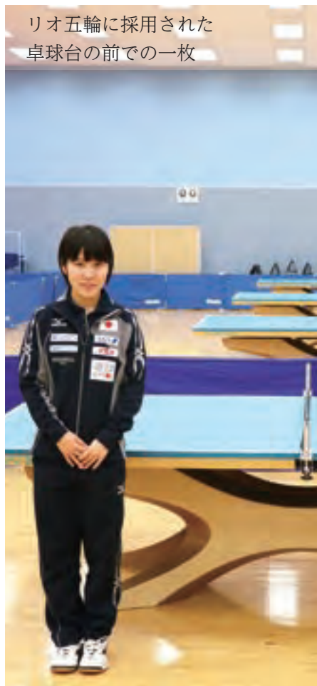
リオ五輪に採用された卓球台の前での一枚

も離れて全部自分でやらないといけないんですけど、卓球の練習はすごい充実しているの。