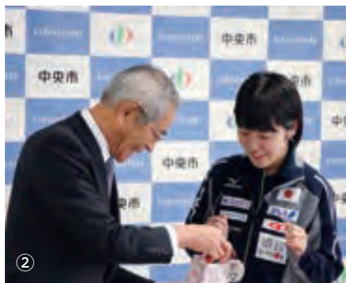
①平野選手の活躍を機に新設したスポーツ栄誉大賞表彰式の様子。第1号の名にふさわしい活躍でした。 ②市長が手渡した「とまチュウ」のキーホルダーに大喜び。対談中も高校生らしい一面をたくさん見せてくれました。