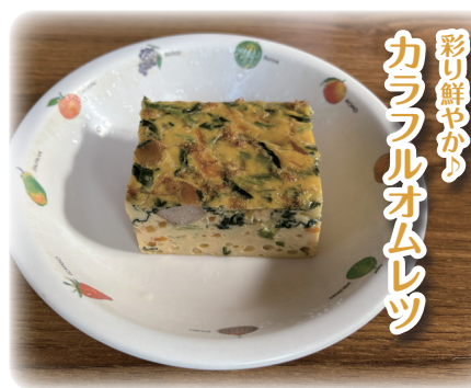
彩り鮮やかなカラフルオムレツ