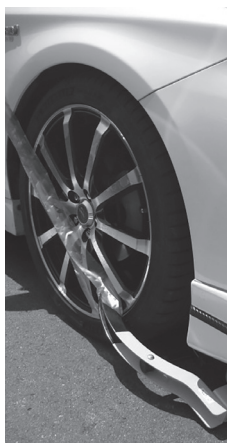
(例)自動車の差し押さえ

自宅などの搜索（強制調査）を行い、家財道具などを差し押さえ（取り上げ）、公売します。