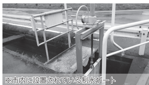
※市内に設置されている制水ゲート