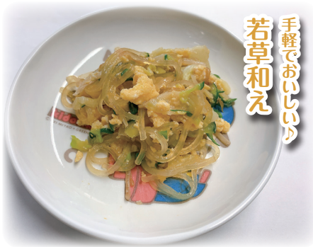
手軽でおいしい！ 若草和え