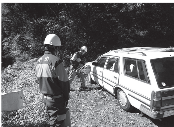
エンジンカッターを使用した救助訓練