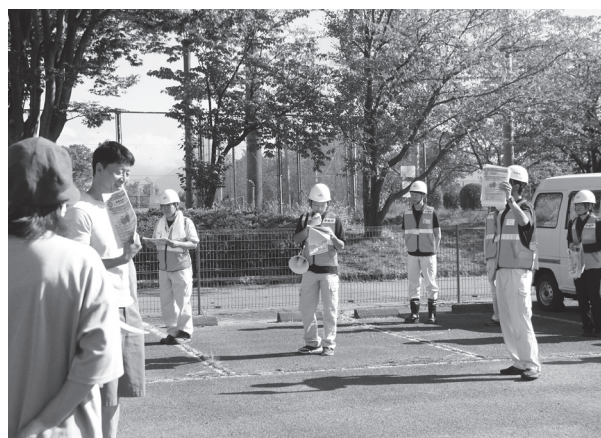
市職員が水害時の行動を説明している様子