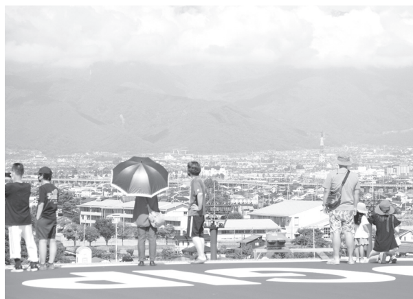
山梨中央ロジパーク屋上ヘリポートから見た市内の様子