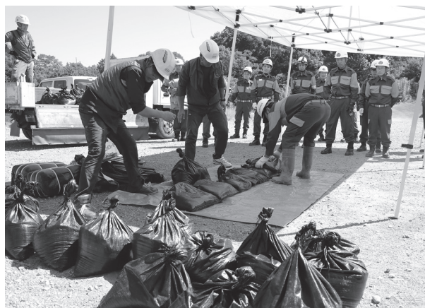
建設協力会による土嚢積みの講習の様子