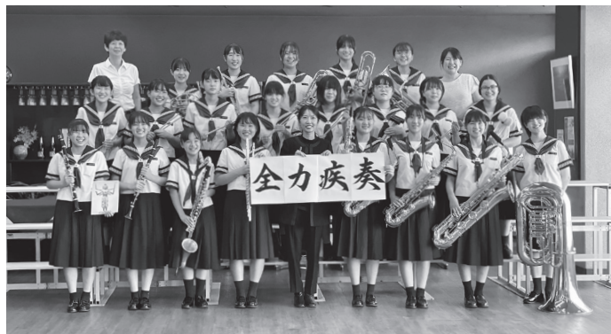
金賞に輝いた田富中学校吹奏楽部のみなさん