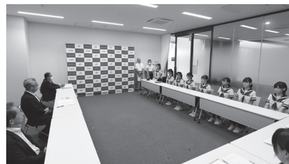
市役所で行われた入賞報告会が行われました