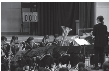
大会前に、演奏曲を披露したときの様子