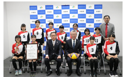
市役所で優勝報告会が行われました