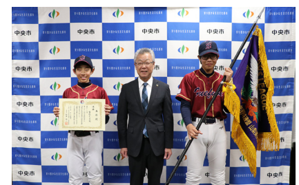
市役所で優勝報告会が行われました