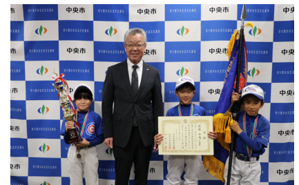
市役所で優勝報告会が行われました