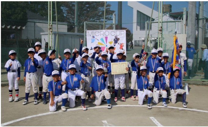
優勝した中央ジュニアベースボールクラブのみなさん

「MICRO CUP第7回山梨県低学年以下学童軟式野球大会」において、中央ジュニアベースボールクラブが出場し、優勝しました！