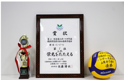
授与された賞状や記念ボール、トロフィーです