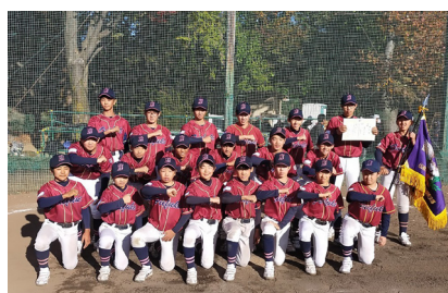
優勝した笛吹ボーイズのみなさん