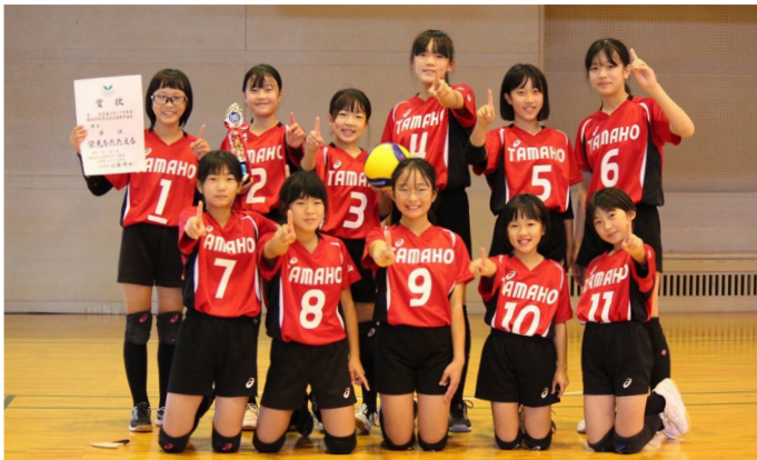
優勝した玉穂バレーボールスポーツ少年団のみなさん

第21回全国スポーツ少年団バレーボール交流大会山梨県予選会に玉穂バレーボールスポーツ少年団が出場し、優勝しました。