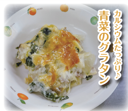
カルシウムたっぷり 青菜のグラタン