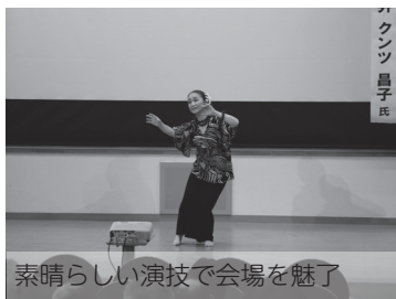
素晴らしい演技で会場を魅了

フォーラムは来年も開催予定です。今回参加できなかった人は、次回の参加をお待ちしています。