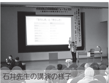
石井先生の講演の様子

参加者からは「家庭内でもコミュニケーションをとり、男女共同参画について話したいと思いました」など