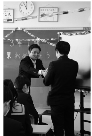
担任の先生と固い握手(玉穂中)