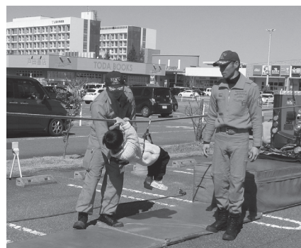
ロープ渡過にチャレンジ！

会場では、みなさんに消防活動を知ってもらうために、消防体験コーナーや消防車両の展示などが行われ、市民の防火意識の高揚を図りました。