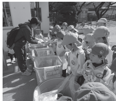
園に戻って、ごみを分別しました

園児は「ビールの缶だ!」「ポロポロ傘だ!」と、宝探しのように張り切っていました。拾ったごみは、分別マークを確認しながら仕分けを行いました。きれいになったまちに、みんなの心が晴れやかになりました。