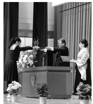
卒業証書を受け取ります(玉穂中)