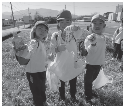
こんなにごみが落ちてたよ

みかさこども園の年中・年長児が市役所周辺の道路、公園、空き地、側溝などのごみ拾いを行いました。