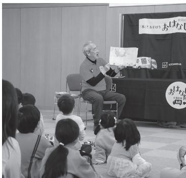
楽しいお話を聞かせてくれました

講談社「本とあそぼう全国訪問おはなし隊」のキャラバンカー見学とおはなし会が行われました。