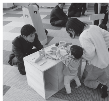
楽しそうに遊ぶ姿が印象的でした

この作品は「課題研究」という授業の一環で、子育て支援センターで活用できるように生徒が設計、製作してくれたものです。ぜひ遊びに来てください!