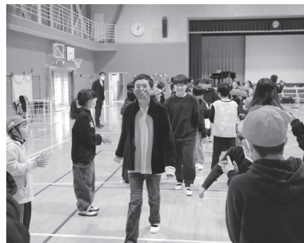
笑顔で6年生を送り出します

豊富小学校で6年生を送る会が開催されました。6年生に感謝の気持ちを込めて、5年生を中心に歌や演奏、メッセージカードを贈りました。6年生からは卒業式に出席できない下級生のために当日に合唱する歌を披露しました。6年生との思い出となるひと時を過ごしました。