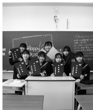
大好きな先生と記念写真!(田富中)