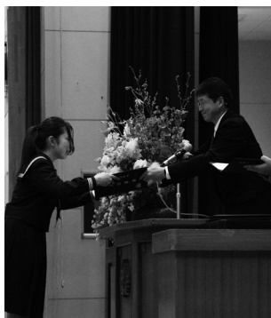
卒業証書を受け取ります(田富中)