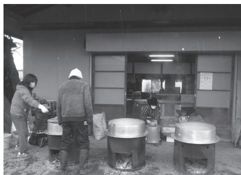
大きな釜で大豆を煮上げます

この味噌づくりは、山宮地区で50年以上前から続けられているようで、無添加の手づくり味噌が作られています。代々受け継がれてきた伝統の味を守り続けてほしいですね。