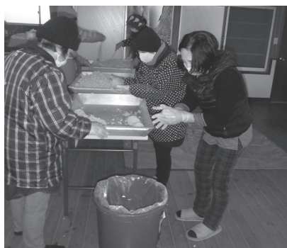
味噌を丸めて桶に詰めています