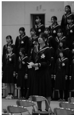
卒業生から感謝の言葉(田富中)