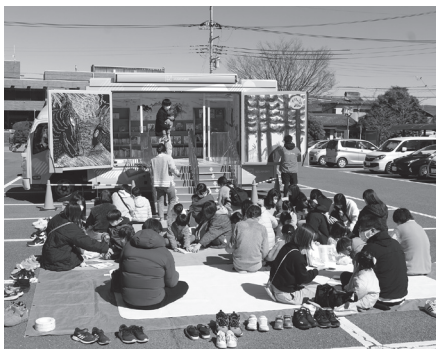
550冊以上の絵本が載せられています

また、おはなし会では絵本の読み聞かせと紙芝居が行われ、子どもたちの笑顔があふれる素敵な時間となりました。