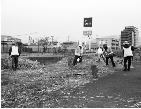
手際よく作業が進められました

中央市田富ボランティア「てんとう虫会」のみなさんが、昭和バイパス沿いの花壇でパンパスグラス刈り取り作業を行いました。この花壇は、てんとう虫会で維持管理しており、毎年さまざまな植物を育ててくれています。きれいに手入れをしていただき、ありがとうございます。