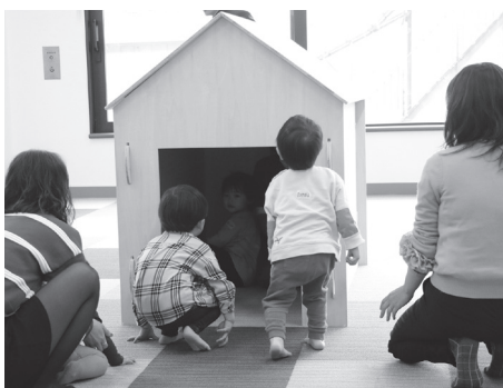
木のお家到大興奮!

子育て支援センター「しん☆ちび」に、甲府工業高校建築科の3年生5人のグループが製作した木製の遊具などが贈られました。