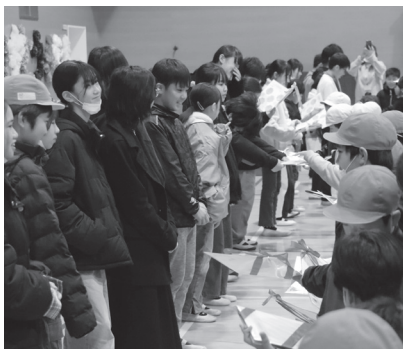
感謝を込めてメッセージカードのプレゼント！

豊富小学校で6年生を送る会が開催されました。6年生に感謝の気持ちを込めて、5年生を中心に歌や演奏、メッセージカードを贈りました。6年生からは卒業式に出席できない下級生のために当日に合唱する歌を披露しました。6年生との思い出となるひと時を過ごしました。