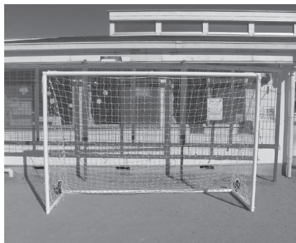
整備されたサッカーゴールです

わんぱく児童館に、サッカーゴールが整備されました。このサッカーゴールは「令和5年度児童福祉施設等創造活動備品整備助成金」の交付を受けて整備されたものです。