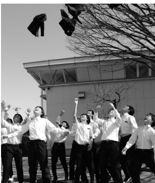
中学校生活終了!! (玉穂中)