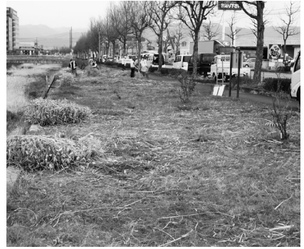
きれいな花が咲くのを楽しみにしています

中央市田富ボランティア「てんとう虫会」のみなさんが、昭和バイパス沿いの花壇でパンパスグラス刈り取り作業を行いました。この花壇は、てんとう虫会で維持管理しており、毎年さまざまな植物を育ててくれています。きれいに手入れをしていただき、ありがとうございます。