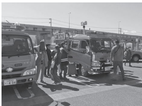
さまざまな車両が展示されました

春季全国火災予防運動に伴い、中央市消防団と甲府地区消防本部の連携による啓発活動が実施されました。