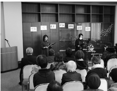
朗読に耳を傾けていました