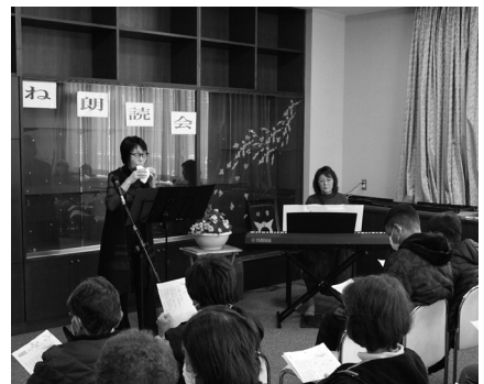
美しい音色が響きました♪

朗読会では「吉四六話」などの物語の朗読やオカリナ・ピアノ演奏など、6つの演目が披露され、会場のみなさんは穏やかな雰囲気の中で、朗読の世界を楽しんでいる様子でした。